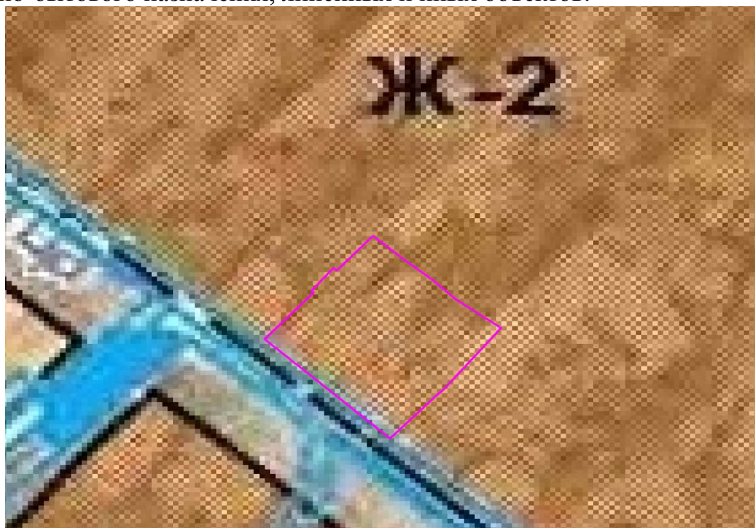
Рис. 1. Схема расположения проектируемого земельного участка относительно территориальных зон.

В зонах застройки малоэтажными многоквартирными жилыми домами допускается размещение объектов, связанных с проживанием граждан и не оказывающих негативного воздействия на окружающую среду, а также стоянок, гаражей, площадок для временной парковки автотранспорта, объектов социального, коммунально-бытового назначения, линейных и иных объектов.