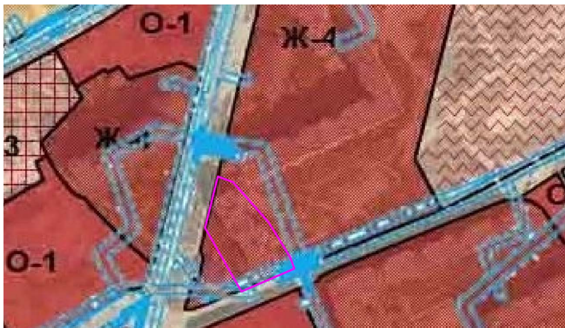
Рис. 1. Схема расположения проектируемого земельного участка относительно территориальных зон.

В зонах жилой многоэтажной застройки допускается размещение объектов, связанных с проживанием граждан и не оказывающих негативного воздействия на окружающую среду, размещение подземных гаражей и автостоянок; спортивных и детских площадок, площадок отдыха и иных объектов.